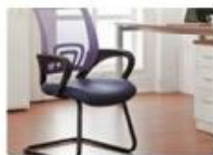
آموزش سیستم سازی کسب و کار