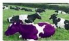
تولید محصول یا محتوا