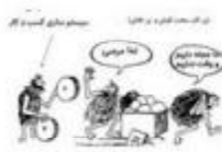
آموزش سیستم سازی کسب و کار

ب - با بهبود عملکرد فردی و بهبود عملکرد سازمانی از طریق سیستم سازی، با کمترین تلاش از زندگی و کسب و کارمان لذت ببریم.